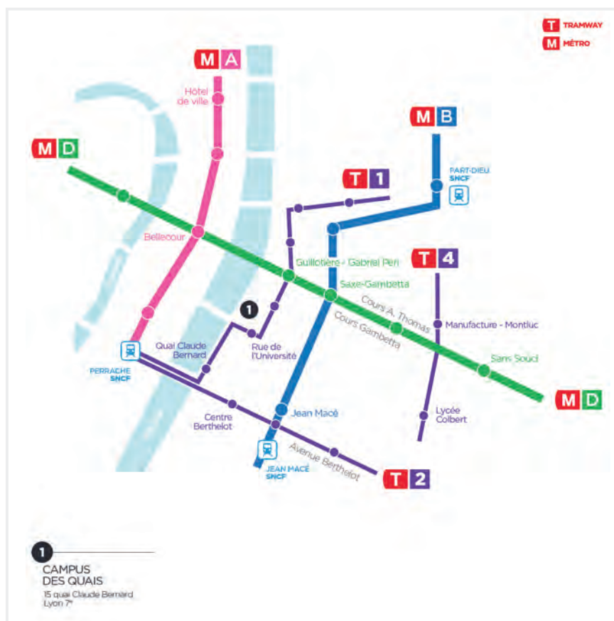
Plan d'accès au site des Quais

Lieu du colloque Université Jean Moulin - Lyon 3 Salle GARRAUD 15 quai Claude Bernard 69007 Lyon